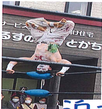
←タイガーマスク 偽物のレスラーです(笑)

外は、朝から雨が降ったり止んだりを繰り返していました。雨を吹き飛ばせと会場は、はるすのスタッフ達が盛り上げていました。