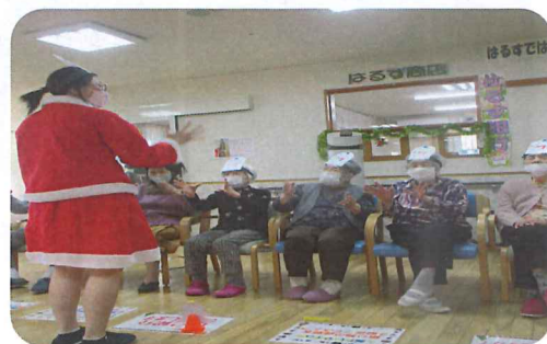
各チームゴール目指しています