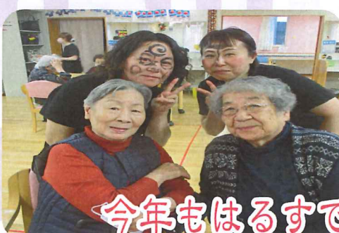
今年もはるすで楽しみましょうね！