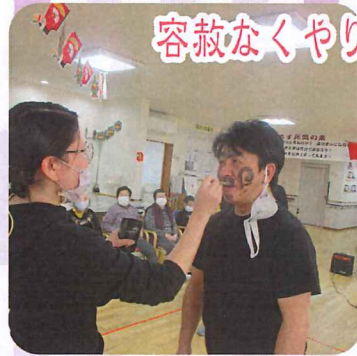
容赦なくやりますよ～