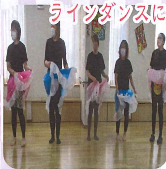
ラインダンスになってますか？