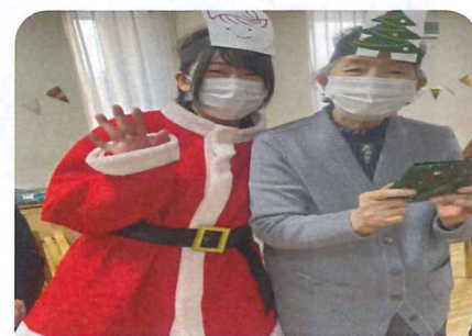
クリスマスプレゼントもらいました